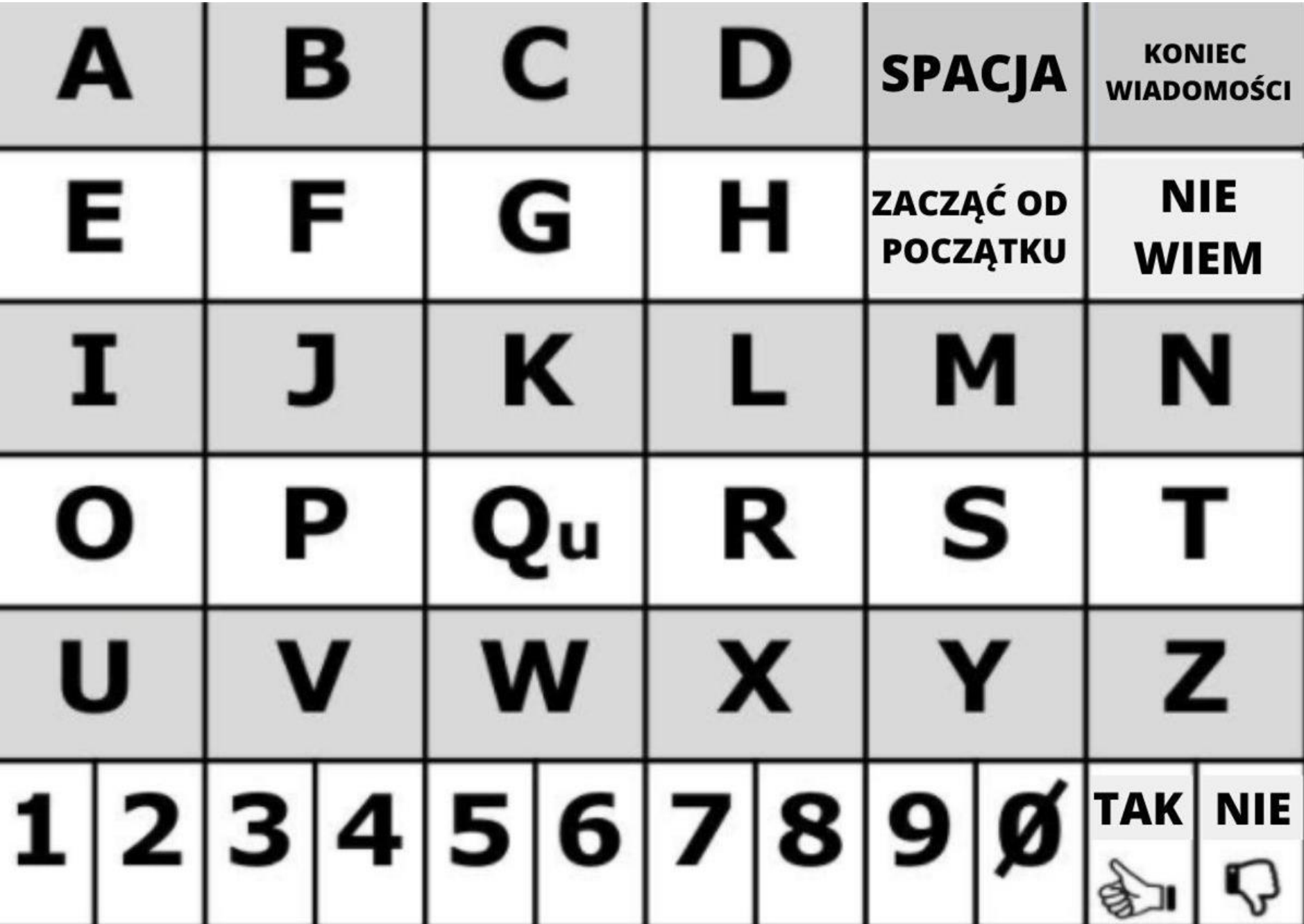
Tablica literowa - AEIOU format